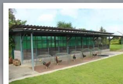
ทำแพงกำบังลมและฝน