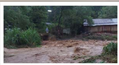
ระวัง น้ำท่วมฉับพลัน