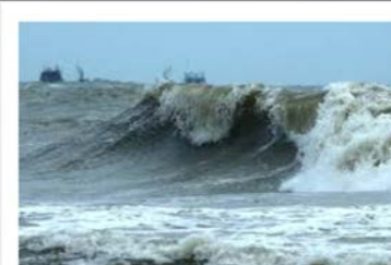
ระวัง คลื่นสูงทะเลอันดามันตอนบน