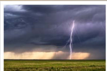
ฝนฟ้าคะนอง