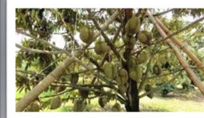
ผูกยึดค้ำยันกิ่งไม้ผล