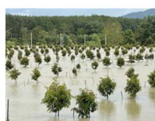
ระวัง น้ำท่วมขังพื้นที่การเกษตร