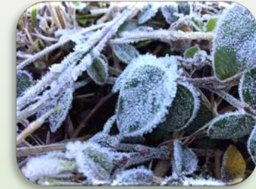
ระวัง น้ำค้างแข็ง

☀️ ความยาวนานแสงแดด 8-10 ชม. ความชื้นสัมพัทธ์ 55-65%