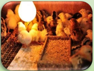
ควบคุมอุณหภูมิโรงเรือน

☀️ ความยาวนานแสงแดด 8-10 ชม. ความชื้นสัมพัทธ์ 55-65%