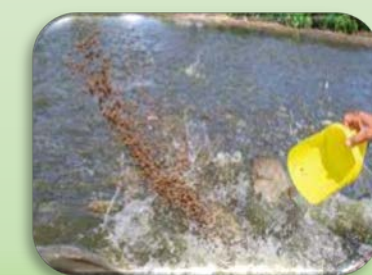
ลดปริมาณอาหารลง

☀️ ความยาวนานแสงแดด 8-10 ชม. ความชื้นสัมพัทธ์ 55-65%