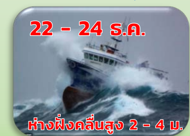
เตือน คลื่นลมแรง