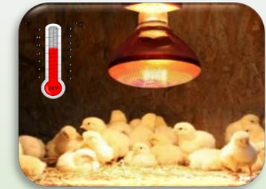
ควบคุมอุณหภูมิโรงเรือน