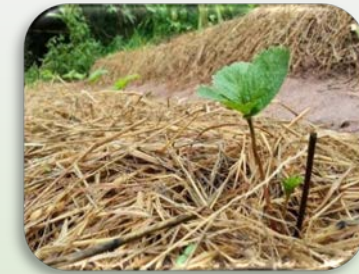
คลุมดินเพื่อรักษาความชื้น

☀️ ความยาวนานแสงแดด 9-10 ชม. ความชื้นสัมพัทธ์ 50-60%