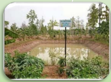
เตรียมเก็บน้ำสำรองไว้ใช้