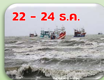
ระวัง คลื่นลมแรงพัดเข้าฝั่ง

☀️ ความยาวนานแสงแดด 4-8 ชม. ความชื้นสัมพัทธ์ 70-90%