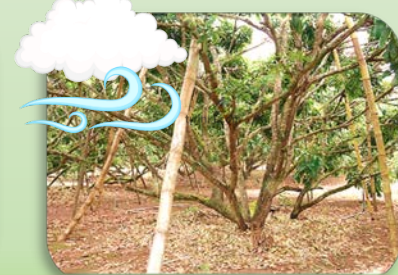
ควร ค้ำยันกิ่งไม้ผล