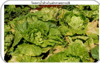
ระวัง โรคพืชที่เกิดจากเชื้อรา

☀ มีฝนเล็กน้อย ☀ 5-8 ชม. ความชื้นสัมพัทธ์ 60-70%