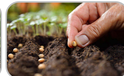
ปลูกพืช อายุเก็บเกี่ยวสั้น ใช้น้ำน้อย