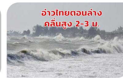
อ่าวไทยตอนล่าง คลื่นสูง 2-3 ม.