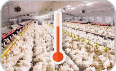
ควบคุม อุณหภูมิในโรงเรือน