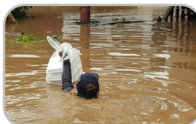
ระวัง อันตรายจากฝนที่ตกหนัก

☀ [22-27 / 27-34] ☀ 4-7 ชม. ความชื้นสัมพัทธ์ 80-90%