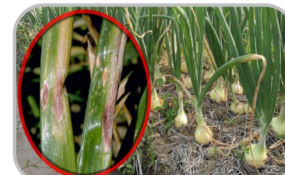
ระวัง โรคพืชที่เกิดจากเชื้อรา

☀ 10-20% ของพื้นที่ ☀ 6-8 ชม. ความชื้นสัมพัทธ์ 60-70%