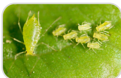
ระวัง ศัตรูพืชจำพวกปากดูด

☀ 10-30% ของพื้นที่ ☀ 5-7 ชม. ความชื้นสัมพัทธ์ 65-75%