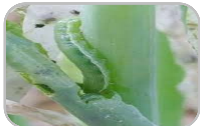
ระวัง ศัตรูพืชจำพวกหนอน

☀ 10-20% ของพื้นที่ ☀ 5-7 ชม. ความชื้นสัมพัทธ์ 65-75%