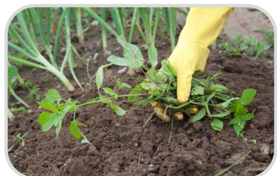
กำจัด วัชพืชในแปลงปลูก