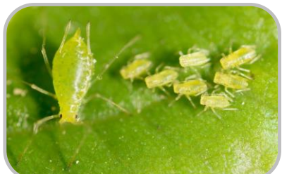
ระวัง ศัตรูพืชจำพวกปากดูด

☀️ - % ของพื้นที่ ☀️ 6-8 ชม. ความชื้นสัมพัทธ์ 60-70%