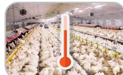
ควบคุมอุณหภูมิ

☀️ - % ของพื้นที่ ☀️ 7-9 ชม. ความชื้นสัมพัทธ์ 60-70%