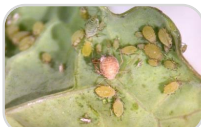
ระวัง ศัตรูพืชจำพวกปากดูด

☀️ - % ของพื้นที่ ☀️ 6-8 ชม. ความชื้นสัมพัทธ์ 60-70%