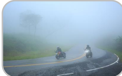
สัญจร ด้วยความระมัดระวัง