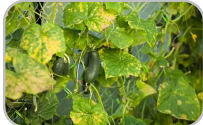
ระวัง โรคพืชที่เกิดจากเชื้อรา

☀️ - % ของพื้นที่ ☀️ 6-8 ชม. ความชื้นสัมพัทธ์ 65-75%