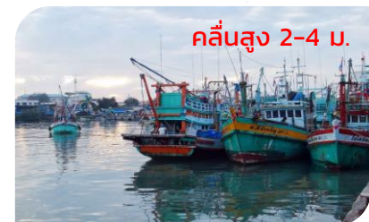
คลื่นสูง 2-4 ม.