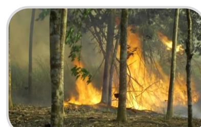
ระวัง การเกิดอัคคีภัย