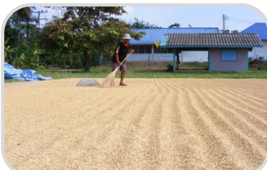
ไม่ควรตากผลผลิต ขำมคั้น