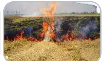
ระวัง การเกิดอัคคีภัย หลีกเลี่ยงการเผา