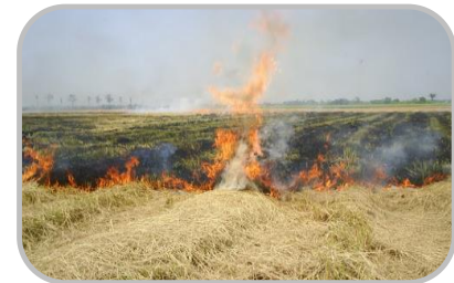
งดเผา เศษวัสดุทางการเกษตร