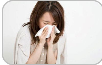
อากาศเปลี่ยนแปลง ดูแลสุขภาพ

☀️ 10-40% ของพื้นที่ ☀️ 5-7 ซม. ความชื้นสัมพัทธ์ 75-85%