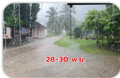
ระวัง ผลผลิตการเกษตรเสียหาย

☀️ 20-40% ของพื้นที่ ☀️ 3-6 ซม. ความชื้นสัมพัทธ์ 75-85%