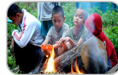
อากาศเปลี่ยนแปลง ดูแลสุขภาพ

☀️ 20-40% ของพื้นที่ ☀️ 4-7 ซม. ความชื้นสัมพัทธ์ 75-85%