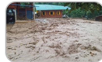
ระวัง อันตรายจากฝนตกหนัก

☀️ [22-25 / 28-34] ☀️ 3-7 ซม. ความชื้นสัมพัทธ์ 85-95%