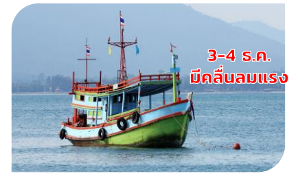
เรือเล็ก งดออกจากฝั่ง