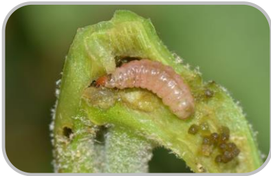
ไม่ตากผลผลิตไว้กลางแจ้งข้ามคืน