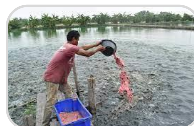
ควบคุม ปริมาณอาหาร