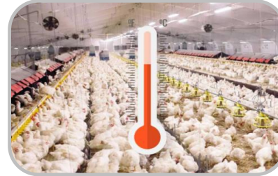
ควบคุมอุณหภูมิโรงเรือน