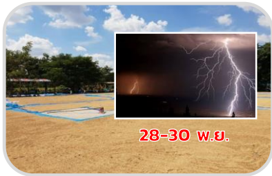
ระวัง ผลผลิตเสียหาย

☀️ 20-40% ของพื้นที่ ☀️ 5-8 ซม. ความชื้นสัมพัทธ์ 75-85%